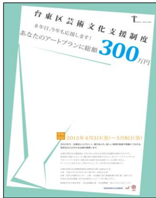
○平成27年度・平成28年度（※同一デザイナーによるデザイン）