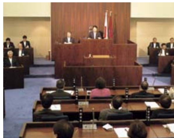
第1回臨時会の様子

また、常任委員会、議会運営委員会の委員を選任するとともに、4つの特別委員会を設置し、委員を選任しました。