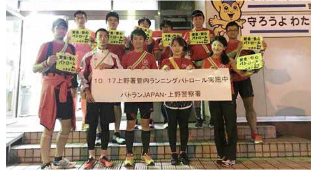
上野管内ランニングパトロール

パトランJAPANは、「安心して暮らせる地域づくりと地域の安全を守る」ことを目的に結成されたボランティア団体で、「走って防犯」を実施しています。上野警察署も本趣旨に賛同し、一緒に管内のランニングパトロールを行うなどの活動をしています。現在では、台東区と台東区内4警察署に活動の輪を広げ、一緒にランニングパトロール活動を行い、台東区内の安全・安心に役立てています。