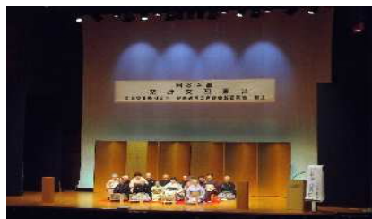
<舞台の様子・台東区能楽連盟>