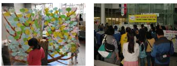
写真は昨年の様子です