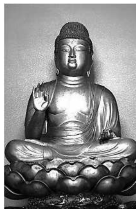
木造阿弥陀如来坐像