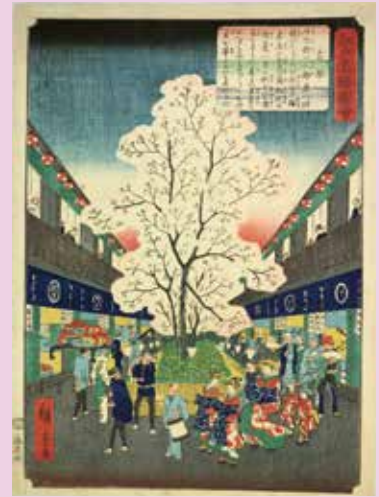
初代歌川広重「江戸名勝図会 吉原」 文久 2 年 (1862)