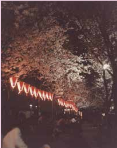
「隅田公園 夜桜」 昭和 58 年 (1983) 4 月