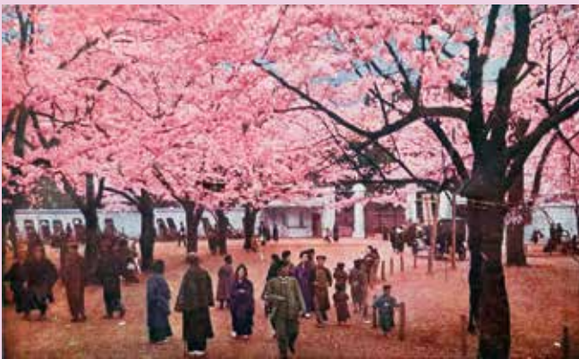
「(帝都桜花) 上野公園動物園前ノ桜」明治末～昭和戦前