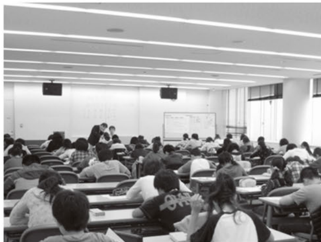
歴史・文化検定会場の様子