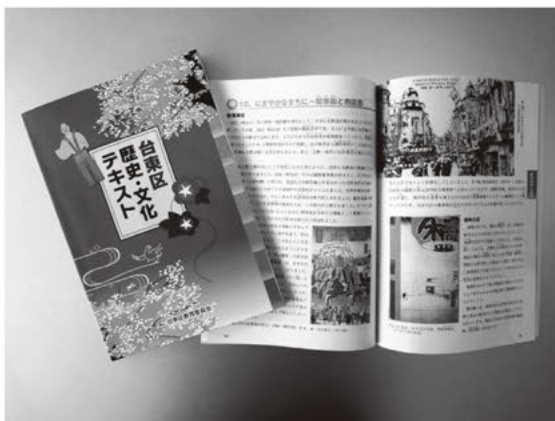
台東区歴史・文化テキスト

今後は、より多く子どもたちが台東区の歴史や伝統、文化を知り、引き継ぐきっかけとなるよう、歴史・文化検定の一層の周知を図っていきます。