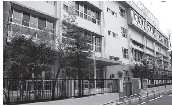
ことぶきこども園の園舎

現在、0歳～5歳の子どもたち131人（平成21年4月1日現在）が、毎日、楽しく元気に過ごしています。