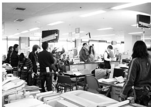
フィルム・コミッション事業の様子②