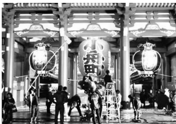
フィルム・コミッション事業の様子①

演劇・芸能などの舞台芸術活動をしている団体に対して、稽古する場所や発表する場所を提供することで、舞台芸術活動の支援・育成を行っています。