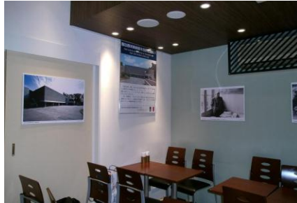
店内のパネル展示の様子