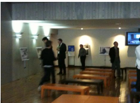
会場外でのパネル展示の様子

※2 OUV（Outstanding Universal Value の略称）：顕著な普遍的価値