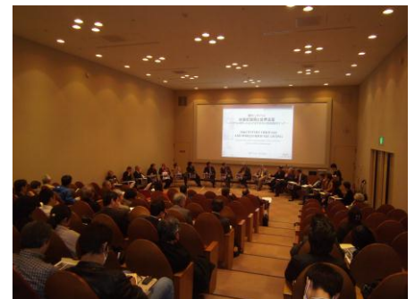
活発な議論が行われた会場内の様子