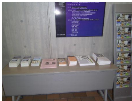
会場外のパンフレットコーナー