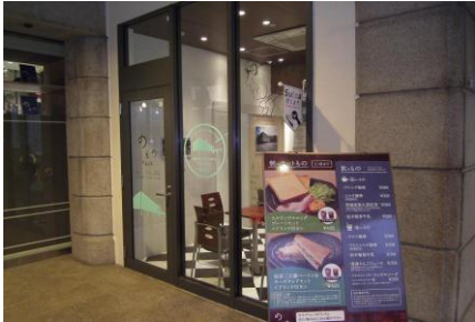
ガラス窓の装飾部分

2月29日（水曜日）から3月20日（火曜日・祝日）までJR上野駅構内の地産品ショップ「のもの」で「台東区のもの」が開催されました。併設の「のものの CAFE」では国立西洋美術館とル・コルビュジエのパネル展示やパンフレットの設置等を行い、国立西洋美術館および世界遺産登録に向けた台東区の取り組みをPRしました。