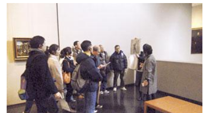
施設見学の様子(館内)