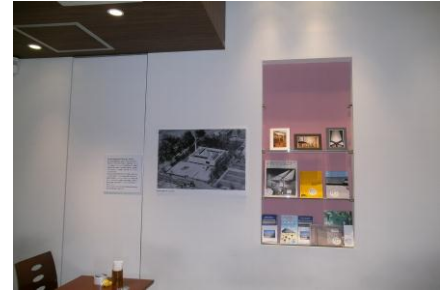
店内に設置したパンフレットや本