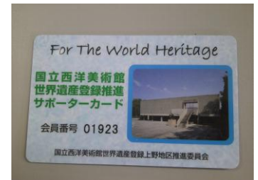
サポーターカード(表面)