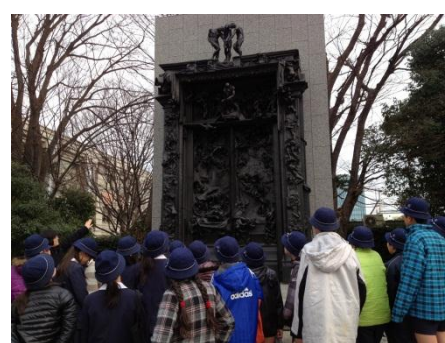
前庭の彫刻の説明を聞いている様子