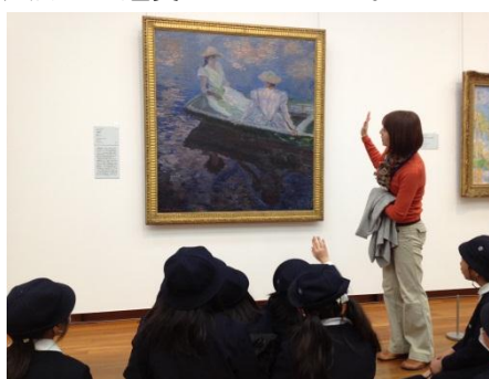
館内の美術作品の説明を聞いている様子