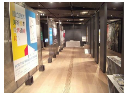
前回の浅草文化観光センターのパネル展