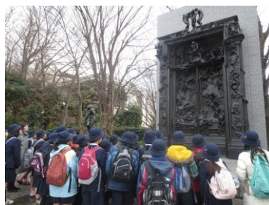
前庭の彫刻の説明を聞いている様子