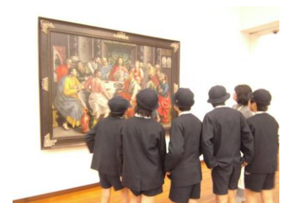
館内の作品の説明を聞いている様子