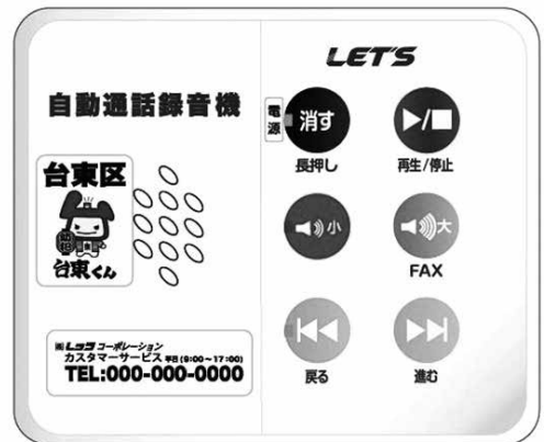
〔自動通話録音機〕イメージ