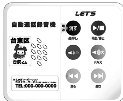
〔自動通話録音機〕イメージ