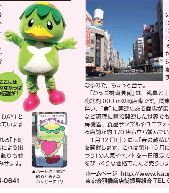
▲かっぱ橋道具街誕生90年を記念して造られたシンボル「かっぱ河太郎」像

200年ほど前に道具街の排水工事を手伝った、伝説のかっぱの子孫！ かっぱ橋道具街の公式キャラクター「かっぱ小町」と「かっぱ河太郎」は、「見ると商売繁盛する」と言われているためか、ちょっとシャイなところも。夏はお皿の水がすぐ乾いてなくなるので、ちょっと苦手。 「かっぱ橋道具街」は、浅草と上野の中間にある南北約800mの商店街です。関東大震災後の復興に伴い、「食」に関連のある店が集まり形成されました。包丁や鍋など調理に直接関連した世界でも珍しい店舗から、飲食店の厨房機器、食品サンプルやユニフォームを扱う店舗まで、食に関する店舗が約170店も立ち並んでいて、一般の方も大歓迎です。 3月12日(土)には「春の蔵いたたききゅうりかっぱ市2016」を開催します。これは毎年10月に開催している「かっぱ橋道具まつり」の人気イベントを一日限定で行うもので、漆器や料理道具をびっくりな価格でたたき売ります。是非お見逃しなく！ ホームページ http://www.kappabashi.or.jp 東京合羽橋商店街振興組合 TEL 03-3844-1225