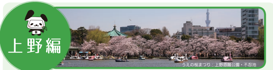
うえの桜まつり：上野恩賜公園・不忍池

台東区には、区を代表する「台東くん」をはじめ、上野動物園にちなんだ「うえのパンダくん」や「ウェルモパンダ」、浅草の「かっぱ小町・かっぱ河太郎」や、「あいかちゃん」のほかにも新しいマスコットキャラクターが登場し、商店街や街を盛り上げています。街で見かけたら、ぜひ声をかけてください！！