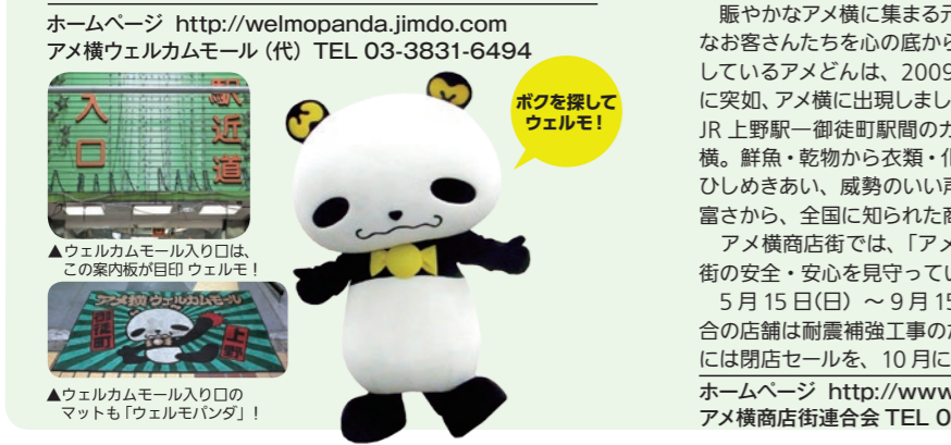
▲ウェルカムモール入り口は、この案内板が目印 ウェルモ！ ▲ウェルカムモール入り口のマットも「ウェルモパンダ」！

舶来雑貨の発信地！こだわりの専門店へ来てウェルモ 「アメ横ウェルカムモール」は、JRの御徒町駅と上野駅を結ぶJR高架下の3商店街(御徒町商業協同組合・上野中央商店街商業協同組合・上野第一商業協同組合)の通称で、ウェルモパンダはこのモールのイメージキャラクターです。上野動物園にやって来たリリーとシンシンを歓迎すべく、2011年に誕生しました。 11月下旬の土・日曜日(2日間)に、アメ横ウェルカムモール「大感謝祭」が開催されます。福引では商品券やウェルモパンダオリジナルグッズがもらえたり、楽しい催しもたくさんあります！是非お越しください。 ホームページ http://welmpanda.jimdo.com アメ横ウェルカムモール(代) TEL 03-3831-6494