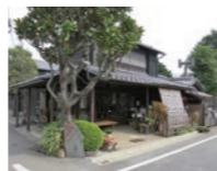
▲創業明治8年の「ふじむらや」

を感じることができます。「さくら通り」と通称される中央園路を北へ日暮里駅方面に向かうと、園路半ば右手に「天王寺駐在所」が出てきます。ここはJR山手線の