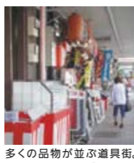
多くの品物が並ぶ道具街。行き交う人もさまざま

合羽橋道具街は、東京随一の調理道具専門店街。外国人旅行者の姿も多く見られます。キッチン的小間物から巨大な調理器具まで、様々なものが売られていて、調理用品でここにはないものはないと言われるほど。思わぬ掘り出し物をぜひ見つけてください!