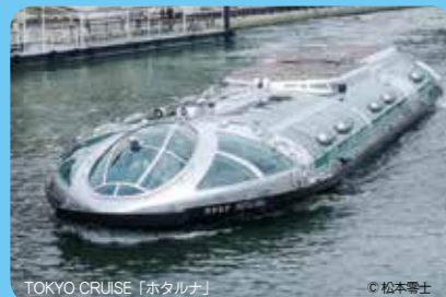
TOKYO CRUISE「ホテルナ」 © 松本零士