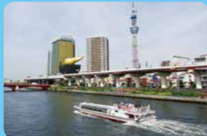
問合せ先 東京水辺ライン http://www.tokyo-park.or.jp/waterbus/

「TOKYO CRUISE」と「東京水辺ライン」が浅草に乗り入れています。それぞれの船や航路に特徴があり、乗り比べても楽しい！ ▶「TOKYO CRUISE」は浅草と日の出桟橋やお台場、豊洲などをつなぐ航路があり、漫画家の松本零士氏デザイン第一弾の「ヒミコ」、昨年就航した第二弾の「ホテルナ」が美しい。他にも気になる船がたくさん！ ▶「東京水辺ライン」は着発場も多く、様々なクルーズが企画されています。通常便の浅草(二天門)～両国発着場間が含まれる航路は特に人気で、乗船時間は10分程度と電車より早く、川風がとても気持ちいい！