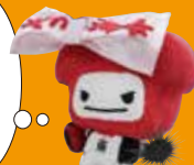
台東区のまもり神 イメージキャラクター 台東くん