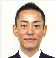
台東区 ビジネスアドバイザー