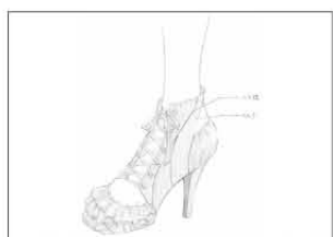
昨年の大賞受賞作