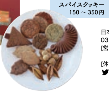
スパイスクッキー 150～350円

店内に入ると混然一体となったスパイスの香りにつまれ、一気に異国気分。SNSで話題のお料理はもちろん、スパイスクッキーも大人気。ピリッと辛かったり、甘じょっぱかったりとひと言で言い表せない美味しさは、舌の肥えた人への手土産にも喜んでもらえそう。