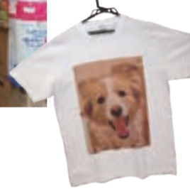
ミルキーちゃんTシャツ 2,200円 (M、L、XL)

お店の前にはボーダーコリーのミルキーちゃん。お客様に撫でてもらって今日もにっこり！表情豊かな人気者です。文具店から始まったお店ですが、お父さんが紙関係の会社にお勤めだったことから、ティッシュペーパーや紙オムツなどの品ぞろえが豊富です。