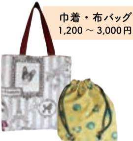
巾着・布バッグ 1,200～3,000円

カーテンやテーブルクロスなど大型のものから、お店の奥で縫われた小物類まで揃うファブリックの専門店。しっかりとしたつくりで軽いバッグは、お子さまの通園・通学用にもどうぞ。生地から選んでのオーダーメイドや、生地の持ち込みにも対応してくれます。