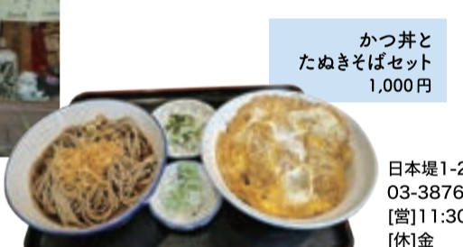
かつ丼と たぬきそばセット 1,000円

3代目ご夫婦で営むお店で、そばもうどんもつゆも全て自家製。かつお節はじめ、素材の風味が生きた昔ながらの味を守っています。老舗とはいえない働く人のために、お腹がいっぱいになるボリュームも特徴で、ご飯ものとおそばを組み合わせたメニューが人気だそう。