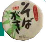
湯を注ぐだけの手軽な本格そばがき。つゆも付いています