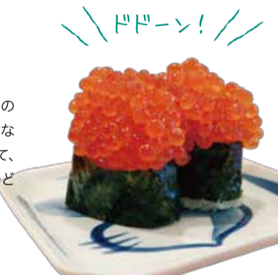
赤字覚悟。迫力のにぼれくら軍艦は堪えられず