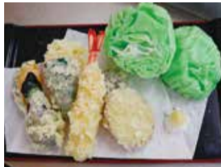
巧みな温度調節で液体から固体へ変化する過程はまさに「非日常のものづくり」

台東区西浅草2-25-9 ☎ 0120-17-1839 [休] なし https://www.ganso-sample.com/