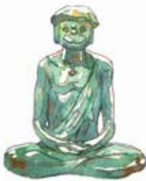
公西会商店街の旗が こちら。他にもかつぱ モチーフがたくさん!