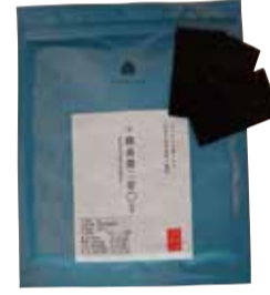
パッケージには風味や口どけなどの段階表記が。食べ比べも楽しい

台東区西浅草3-7-2 ☎ 050-1745-9617 [休] 水・金 https://numatanori.com/