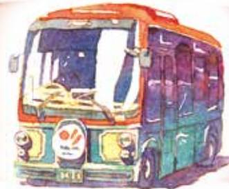
めぐりんバス停 東西めぐりん「西浅草三丁目」