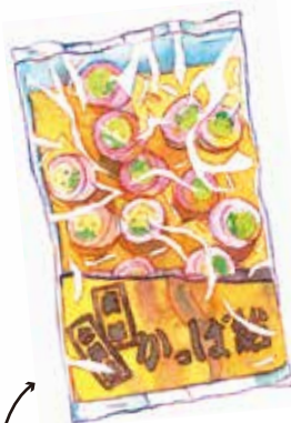
素朴な味の かつぱ飴(250円)は 萬藤のオリジナル