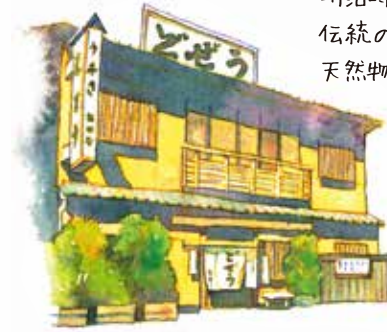
明治時代から続く老舗の 伝統の味を守るため、今も 天然物を厳選しているそうです