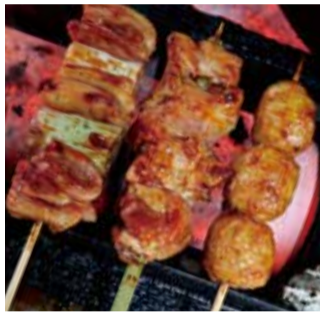
焼き鳥は130円〜。先代の奥さんが考案した秘伝のタレを継ぎ足しながら使用している