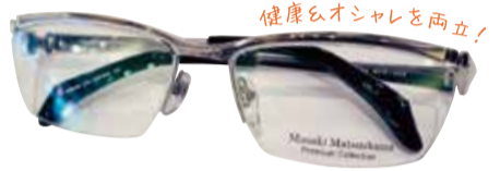
健康にオアシスを両立!