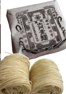
富士山産の大門素麺は手で丸めた独特のかたちが味わい深い

台東区西浅草3-5-2 ☎ 03-3844-1220 [休] 土・日 (7・12月は日のみ) http://www.mantou.co.jp/kapabashi/