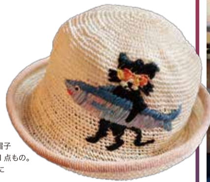
手刺しゅうの帽子(7,300円)は1点もの。出合いを大切に

台東区西浅草3-4-2 ☎ 03-6886-7371 [休] 不定休 http://www.hareto.com/