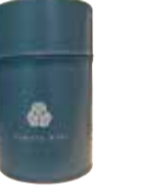
缶入りもあるので贈答にも。色は有明の海をイメージ