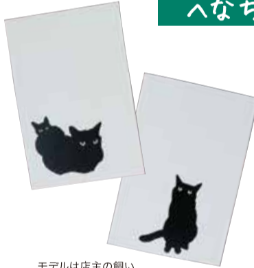
モデルは店主の飼猫・カルとアラレ。同モチーフのTシャツも