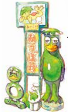
僕たちを 見つけて!