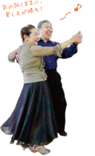
気の向くままに楽しむが勝ち!