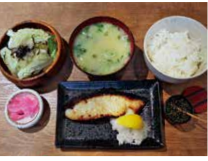
銀ダラの柏漬はランチの自信作。アゴだしのみそ汁も沁みる