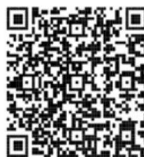
台東区ホームページ