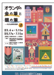
展示会 「オランダの金の筆と銀の筆 —子どもの本の世界—」