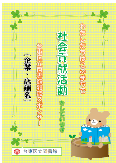
（社会貢献活動PR用掲示物）