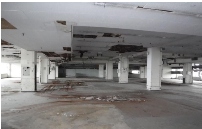
7階（旧作業室・コンテナセンター）