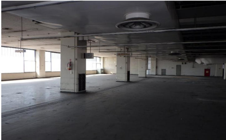
5階（旧作業室・コンテナセンター）