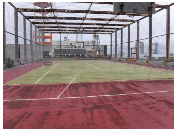
屋上（旧レクリエーション広場）