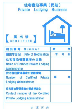
(住宅宿泊管理者が業務を行う場合)