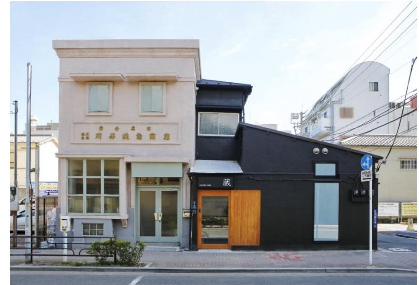
名称: Hostel Kura and Gold Exchange Bar & Cafe

選定委員の評価:大正時代から戦火をくぐりぬけ地域の風景を形づくってきた商店を、新しい業態に生まれ変わりながらも、長く親しまれてきた建物を活用し、歴史的な景観資源の保全に貢献している