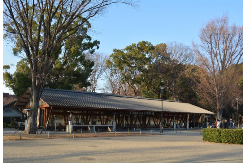
名称:上野恩賜公園 カフェ

選定委員の評価:公園内施設として控えめでシンプルな勾配屋根のフォルムでまとめている。採用した色彩も穏やかでナチュラルであり、公園の景観に溶け込んでいる。噴水の軸線にほぼ対称に配置され公園の良さを盛り立てている。結果、行列のできる人気施設となった。