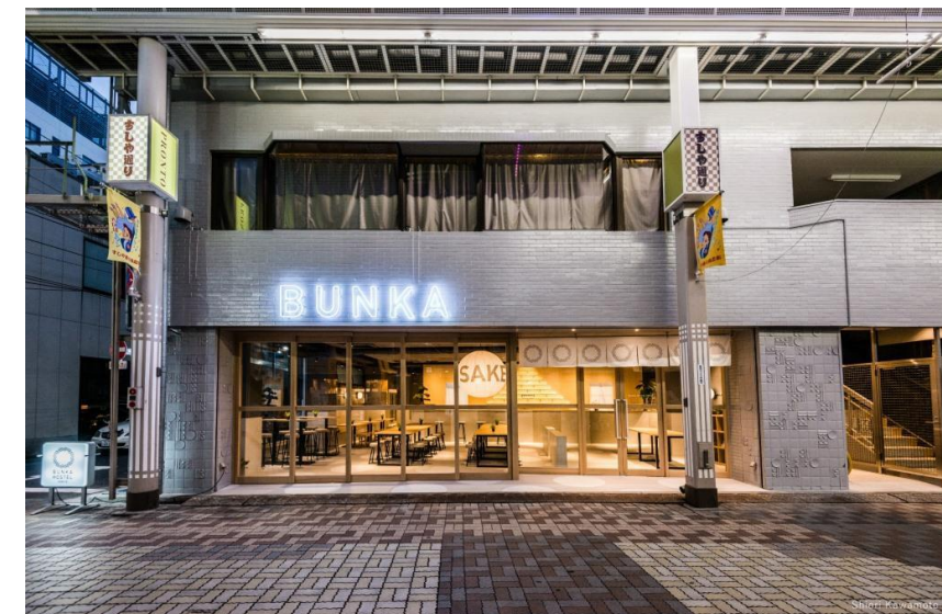
名称:BUNKA HOSTEL TOKYO

選定委員の評価:建物内外の垣根が感じられないほどの躍動感が通りに伝わってきます。浅草に創られる建物の見本と言っても過言では無いでしょう。