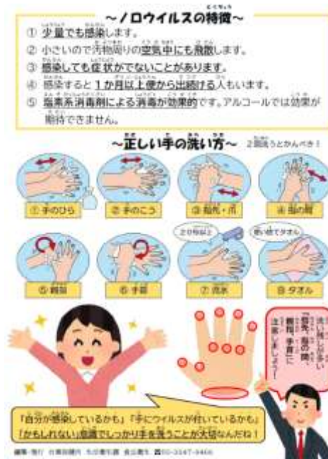
食中毒予防チラシ