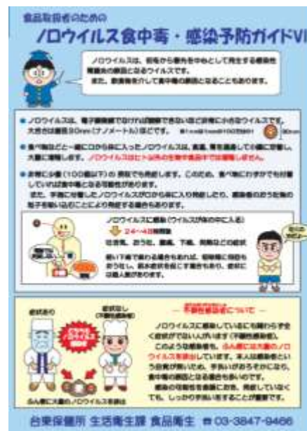
ノロウイルス食中毒・感染予防の冊子