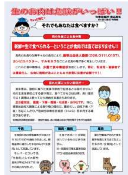
食肉の生食による食中毒防止のリーフレット