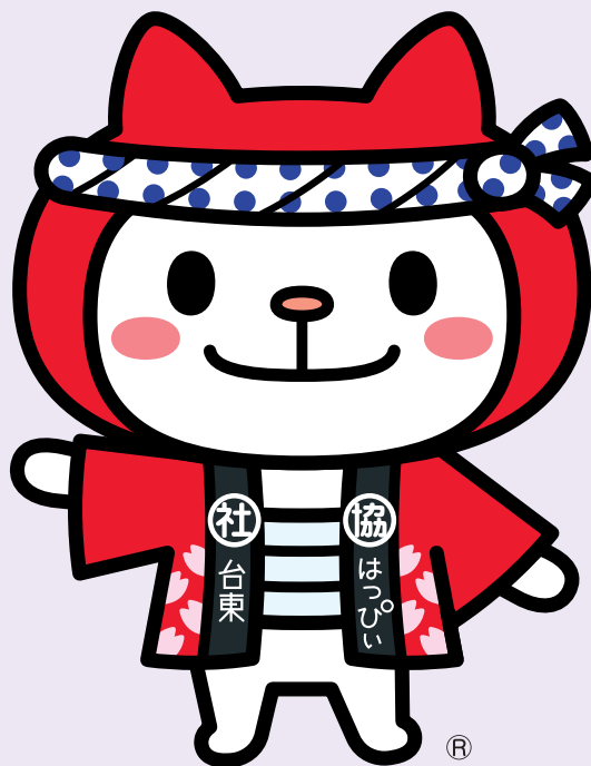
台東区社会福祉協議会 キャラクター はっぴい