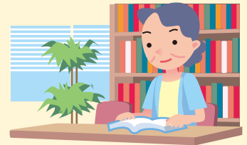
涼しい場所、施設を利用する