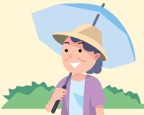
涼しい服装をし、 外出時は日傘、帽子を利用する