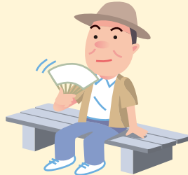
外出の際は こまめに休憩をとる