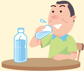
こまめに水分補給する