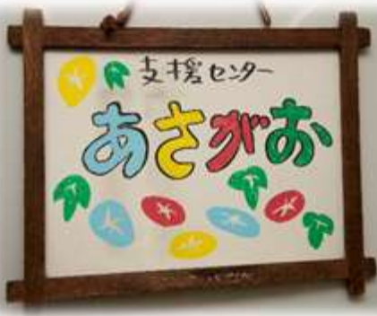
< 入口看板 >