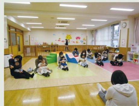
保護者向け育児講座