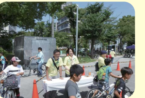
わんぱくトライアスロン