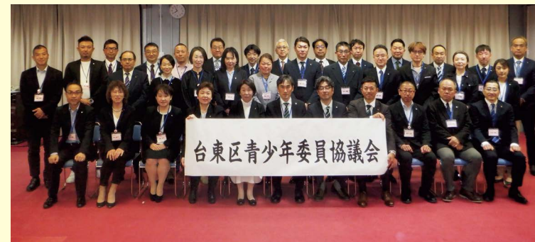
台東区青少年委員協議会