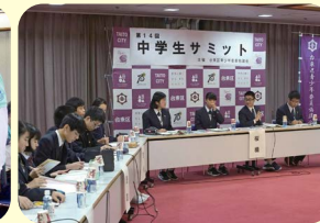
中学生対象事業 中学生サミット