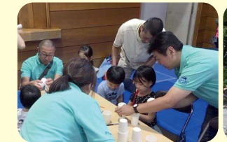
下町こどもまつり