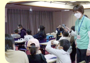
小学生対象事業 親子ふしぎ発見塾

地域や学校、PTAと連携して青少年の健全な育成に取り組む活動をしています。また、地域内の青少年関係団体との交流促進にも取り組んでいます。