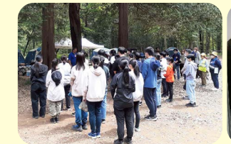
少年リーダー研修会