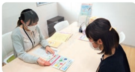
ゆりかご・たいとう面接