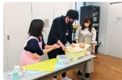
ハローベビー学級