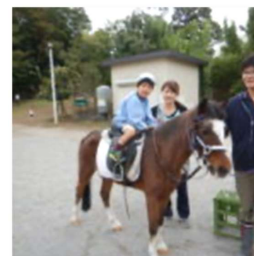
・ポニーふれあい