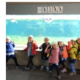
・園外保育（葛西臨海水族園）