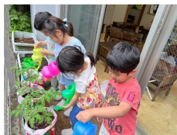
食育:野菜、バケツ稲の栽培