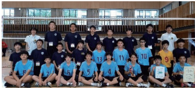
浅草中学校 男子バレーボール部