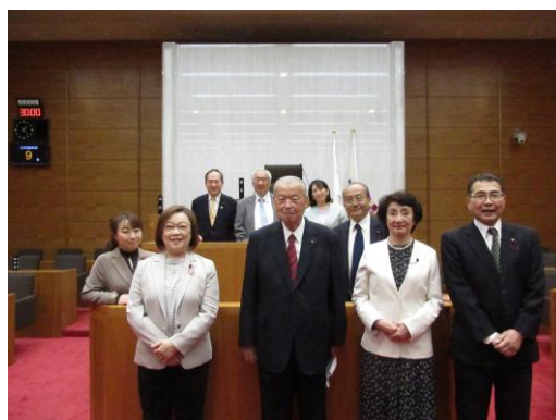
豊橋市議会議場にて