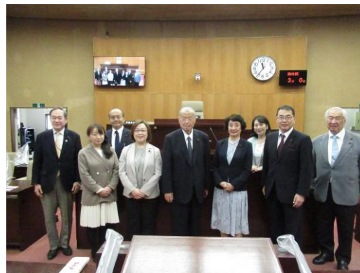
三島市議会議場にて