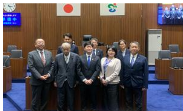
宗像市議会 議場にて