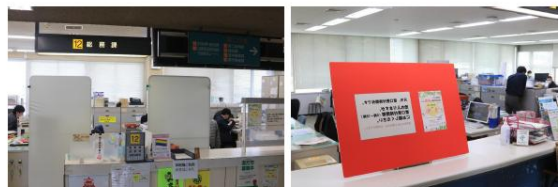
（古賀市資料より抜粋）