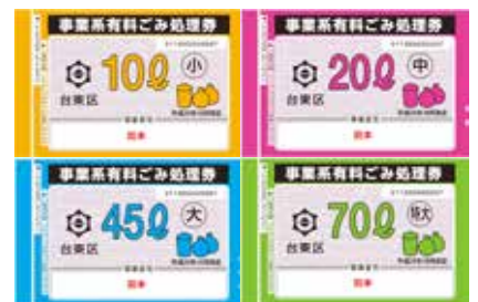
台东区事业类收费垃圾处理券

从公司或店铺中扔出垃圾时需要收费。请联系废弃物处理公司或资源回收公司。量不多时可贴上“台东区事业类收费垃圾处理券”和在从家中扔出垃圾的同一天扔出。（45L 大致为 3 袋）