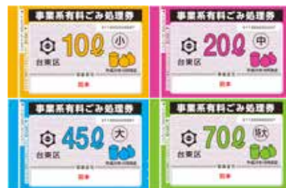
台东区事业类收费垃圾处理券

从公司或店铺中扔出垃圾时需要收费。请联系废弃物处理公司或资源回收公司（详情请在台东区的网站上确认）。量不多时可贴上“台东区事业类收费垃圾处理券”和在从家中扔出垃圾的同一天扔出。（45L 大致为 3 袋）