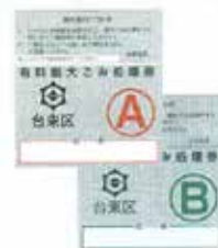
购买大件垃圾处理券黏贴