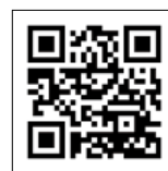
台东区的传统工艺 网站