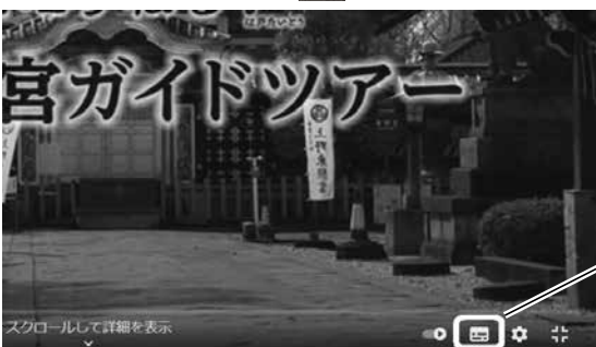
① 字幕 ボタン