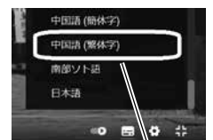
⑤ あなたの 国の 言葉

※ スマートフォンなどで 見ると、英語の 翻訳で 見る ことができます。他の 言語は 見る できません。