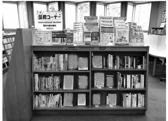
ちゅうおうとしょかんあさくさばしぶんしつ 中央図書館浅草橋分室

月曜日から 土曜日:午前9時から 午後8時まで 日曜日:午前9時から 午後5時まで (年末年始(12/29から1/3)と 毎月 3週目の 木曜日、本を 整理する 日は 休みです)