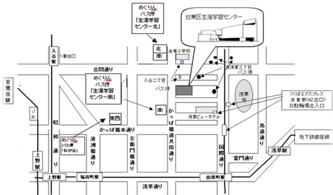
■案内図 台東区西浅草3-25-16