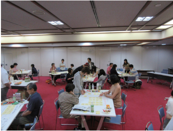
台東区基本構想策定のための区民ワークショップ