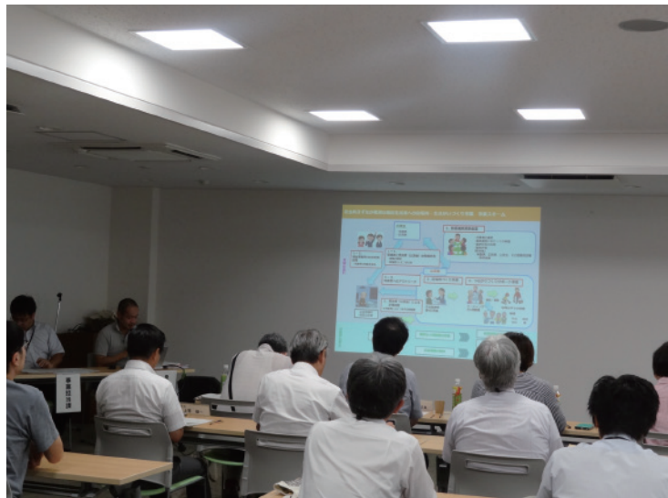
協働事業提案制度 中間報告会