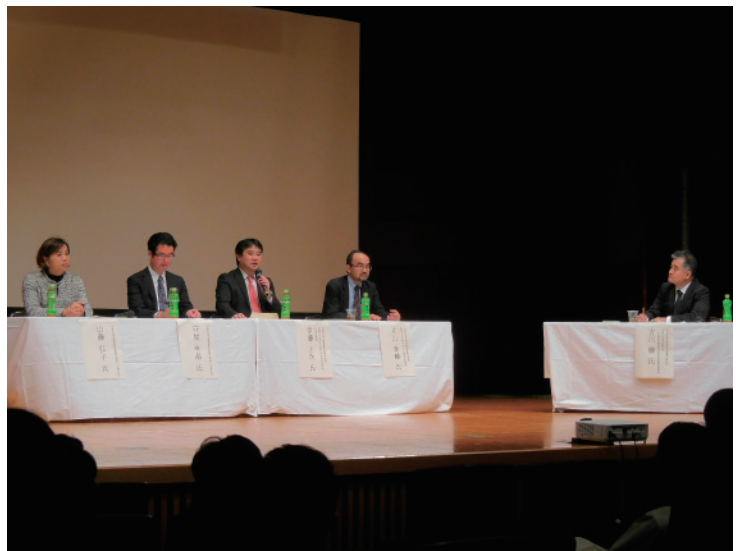
台東区基本構想パネルディスカッション