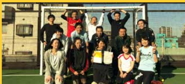
▲所属対抗フットサル大会

また、区役所本庁舎には職員食堂があり、豊富なメニューをリーズナブルな値段で提供しています。