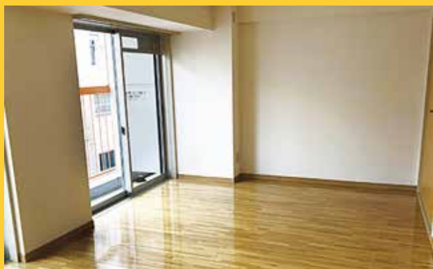
▲単身用職員住宅の一例

区内5か所に職員住宅があります。新規採用職員に対しては、入区前に募集を行います。また、入居希望者を対象に内覧会も実施しています。希望に添えなかった場合でも、空き室状況に応じて定期的に申し込みを行うことができます。なお、職員住宅は単身用49戸・世帯用34戸あり、若手から子育て世代まで、幅広い世代に対応しています。