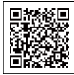
▲思春期サポートプレイス

不登校やひきこもりの状態にある 思春期のお子様について、心理や 医療、福祉等の専門家と共に考え る場を提供しています。