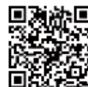
▲とうきょう子育てスイッチアプリ

妊婦から18歳になった最初の3月31日を迎えるまでのお子さんのいる世帯が、パスポートを提示することにより、協賛店舗が提供する割引などのサービスが受けられます。詳細については、東京都の子育て応援サイト「東京スイッチ」やアプリでご確認ください。